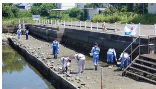
「潮彩の渚」でのゴミ拾い状況