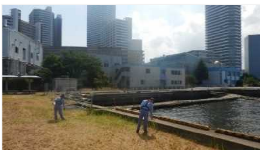
護岸上でのゴミ拾い状況