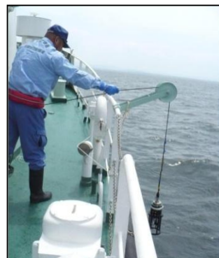
水質調査の実施状況