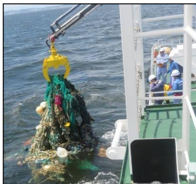
浮遊ゴミの回収作業