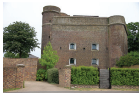
Medway 市における国防遺産の利活用例

横須賀の姉妹都市であるイギリス南岸のMedway市は、横須賀同様に国防拠点として発展した都市です。市内には国防遺産の優れた活用事例があるほか、同沿岸部ハンプシャー州にある「Spitbank 海堡」は、原形をしっかりと維持しながらも別用途に見事に活用されています。姉妹都市にこのような「学ぶべき知恵」が多数埋まっていることはまさに現代の横須賀の「幸運」と言えるでしょう。使える知恵は食欲に吸収するという明治以来の日本人の意気込みを、今度は国防遺産の活用というジャンルでも大いに発揮したいところです。