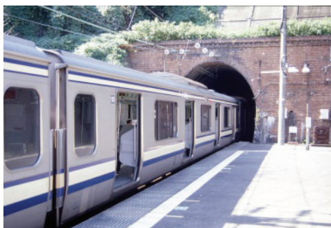
JR 田浦駅のドアカット

上町台地、大楠など丘陵性の地塁山地が卓越する地形を反映し、擁壁やトンネルなどの特徴的な構造物が市内に多数存在しています。市内の主要な幹線道路である久里浜田浦線の阿部倉地区や安浦下浦線の粟田地区には円柱の連続する外観が目立つ深礎擁壁が整備されています。また、“谷戸”を横断するトンネルも多数存在し、それらを集めた「横須賀トンネルマップ」も作成されています。特にJR田浦駅のドアカットは名所と呼ぶに相応しい事例と言えるでしょう。これについては自分も注目しており、奈良文化財研究所(2013)