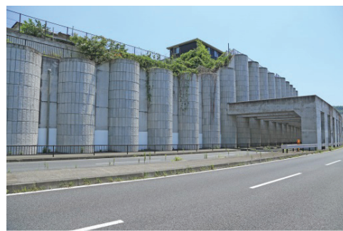
久里浜田浦線深礎擁壁（阿部倉）

ヴェルニー公園をはじめ、F倉庫や海上自衛隊艦船補給処食糧庫など戦前の特徴的な倉庫群が港湾部に点在しています。また、久里浜港に1969年に整備された東京電力横須賀火力発電所の排気塔などは港の重要なランドマークとして活用できる貴重なランドスケープ遺産と言えます。