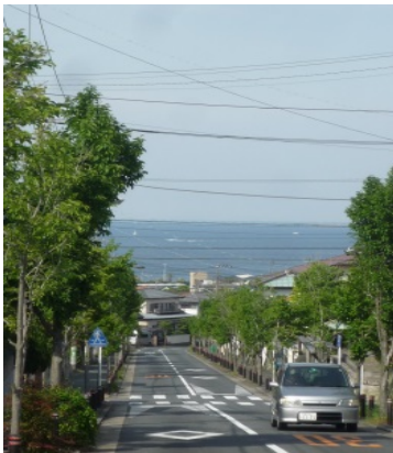
「住宅地内型」の坂の例