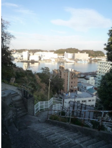
「台地・平地連絡路型」の坂の例

地方創生が叫ばれる昨今、地域の活性化のためには、その魅力（個性）を再発見し活用していくことが必要となってくる。今年、横須賀港が開港 150 周年を迎えるにあたり、みなとまち横須賀の魅力（みなとまちらしさ）について考えてみることにし、ここでは、①海と船が見える坂道、②独特の風情を持つパン屋、③角打ち、④米国文化の 4 つを取り上げる。