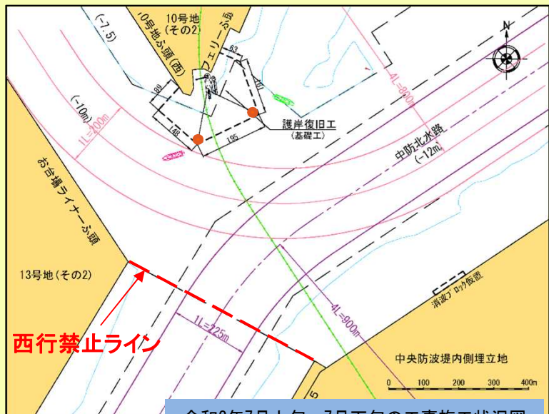
令和2年7月上旬～7月下旬の工事施工状況図

※令和2年9月中旬～令和3年3月 中旬までは、10号地側、中防側 で護岸復旧工のため作業範囲を設 定し工事予定。