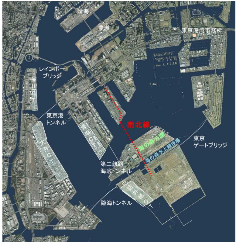
東京港臨港道路南北線の位置

なお、臨港道路南北線は、東京2020大会の際には関係者輸送ルートとしての活用も想定されています。