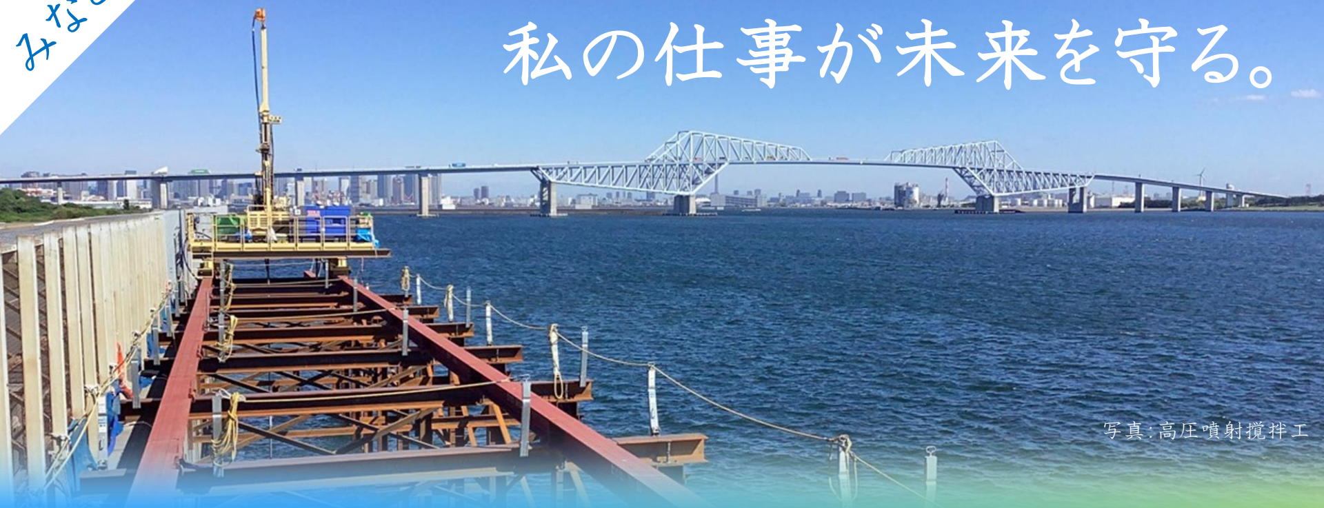
写真:高圧噴射攪拌工