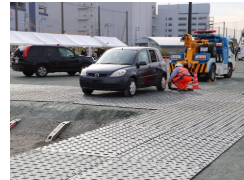
輸送路啓開訓練 (日本自動車連盟・神奈川県警)