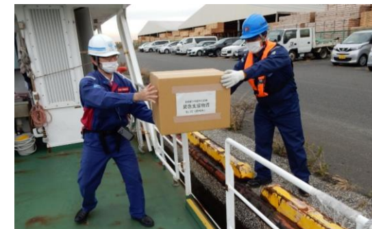
緊急支援物資荷海上輸送訓練 (関東地方整備局)