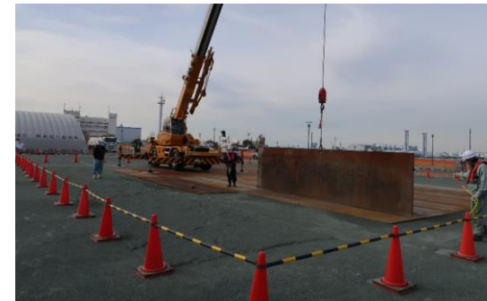
防災拠点等応急復旧訓練 (埋浚協会・日立建機日本)