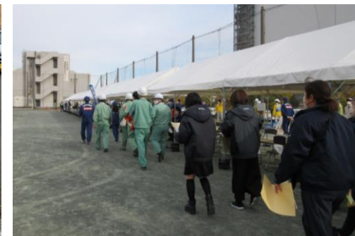
津波避難・帰宅困難者輸送訓練 (関東地方整備局・川崎市)