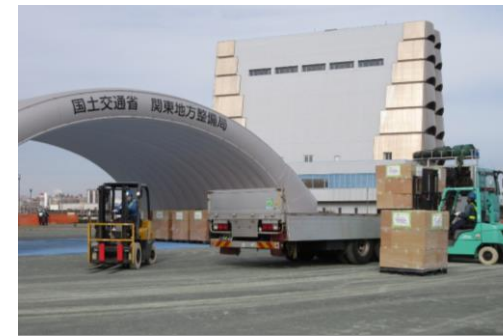
緊急支援物資荷さばき訓練 (川崎港運協会)