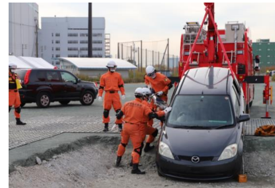
人命救助訓練 (川崎市・神奈川県警)