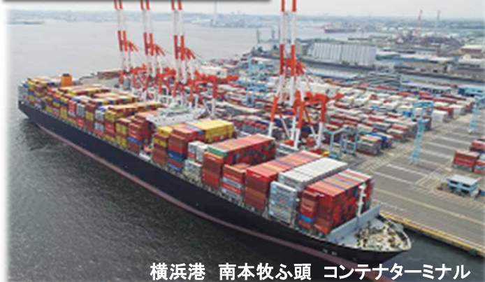
横浜港 南本牧ふ頭 コンテナターミナル