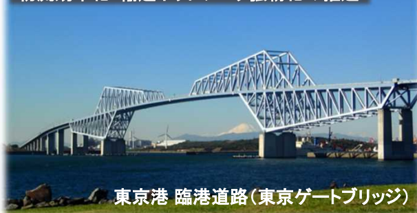
東京港 臨港道路(東京ゲートブリッジ)