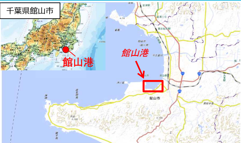
国土地理院地図(電子国土Web) ( https://maps.gsi.go.jp )をもとに国土交通省作成