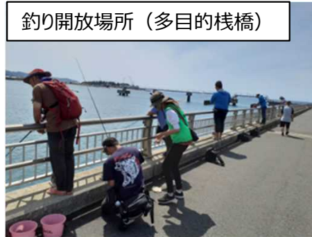
釣り開放場所 (多目的栈橋)