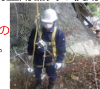
【墜落制止用器具の使用】