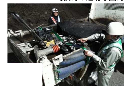
【積荷の適切な固縛】

※「VII.事故防止」の重点的安全対策として実施すべき内容は、基本的な安全対策をまとめたものであり、下請が単独で起こした事故であっても、当該内容の指導が不十分であったとして、受注者に対し、必要に応じて厳しい措置を行うこととする。