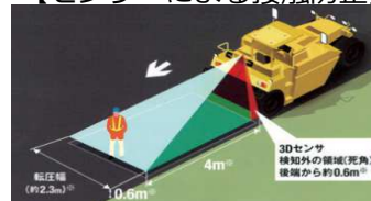
【センサーによる接触防止】