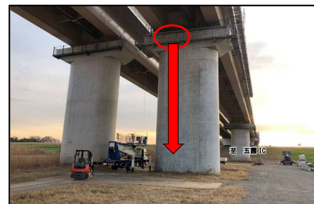
橋梁の下部工検査路設置作業中、作業員1名が転落し死亡が確認された事案

令和5年度は足場・法面等からの墜落・転落による死亡事故が3件発生しています。墜落・転落事故の中には、墜落制止用器具（安全带）を使用していたものの、その掛替え時に墜落・転落した事案もあることから、足場の組立て等作業時における「墜落制止用器具（安全带）の二丁掛」について、令和6年度より新たに実施すべき内容として追加しています。