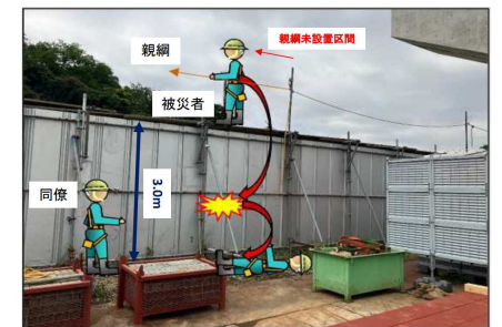
未終了の足場板上を歩行し、足元の足場板が傾斜したことによりバランスを崩し、地上へ墜落した事案