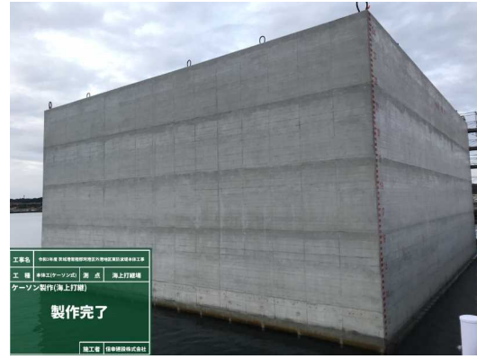
ケーソン製作完成