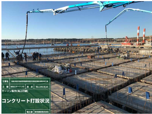
コンクリート打設状況