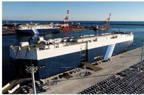
茨城港常陸那珂港区中央ふ頭