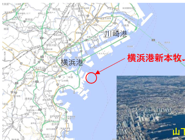
横浜港新本牧ふ頭

新本牧ふ頭のコンテナターミナルは、日本最大級（水深18m、岸壁延長1,000m）の岸壁を有することから、世界最大級のコンテナ船が2隻同時に着岸可能となります。