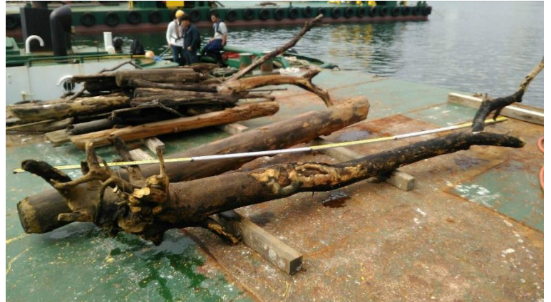
日本埋立浚渫協会が回収した漂流物(流木)