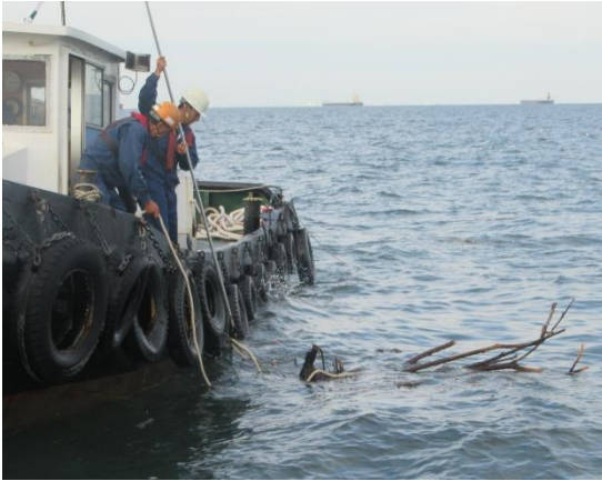
日本埋立浚渫協会による漂流物の回収