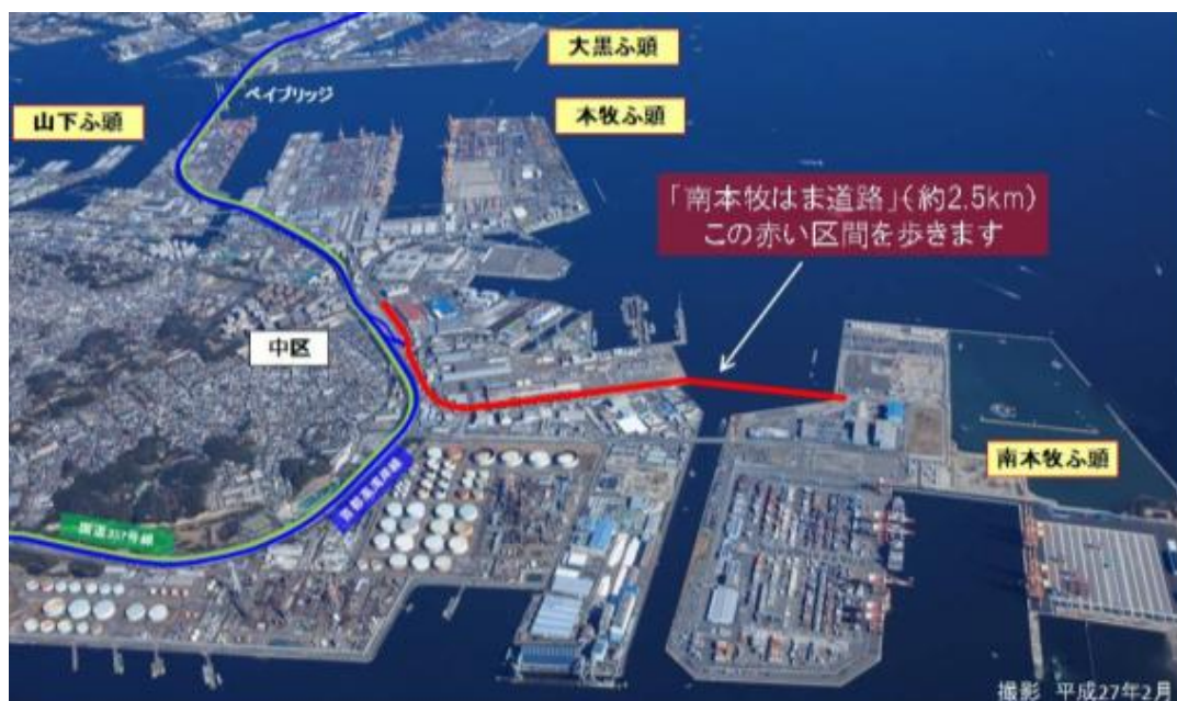
図-1 ウォーキング場所

※ウォーキングイベントの取材をご希望される報道関係者の方は、(別紙-4)取材要領をご確認のうえ、平成29年2月28日(火)18:00までに(別紙-5)取材申込書に必要事項をご記入いただき、FAXによりお申し込み下さい。