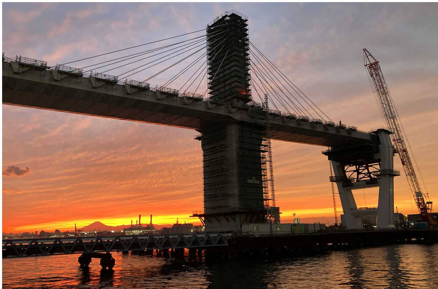
川崎港臨港道路東扇島水江町線 現場と富士山夕焼け