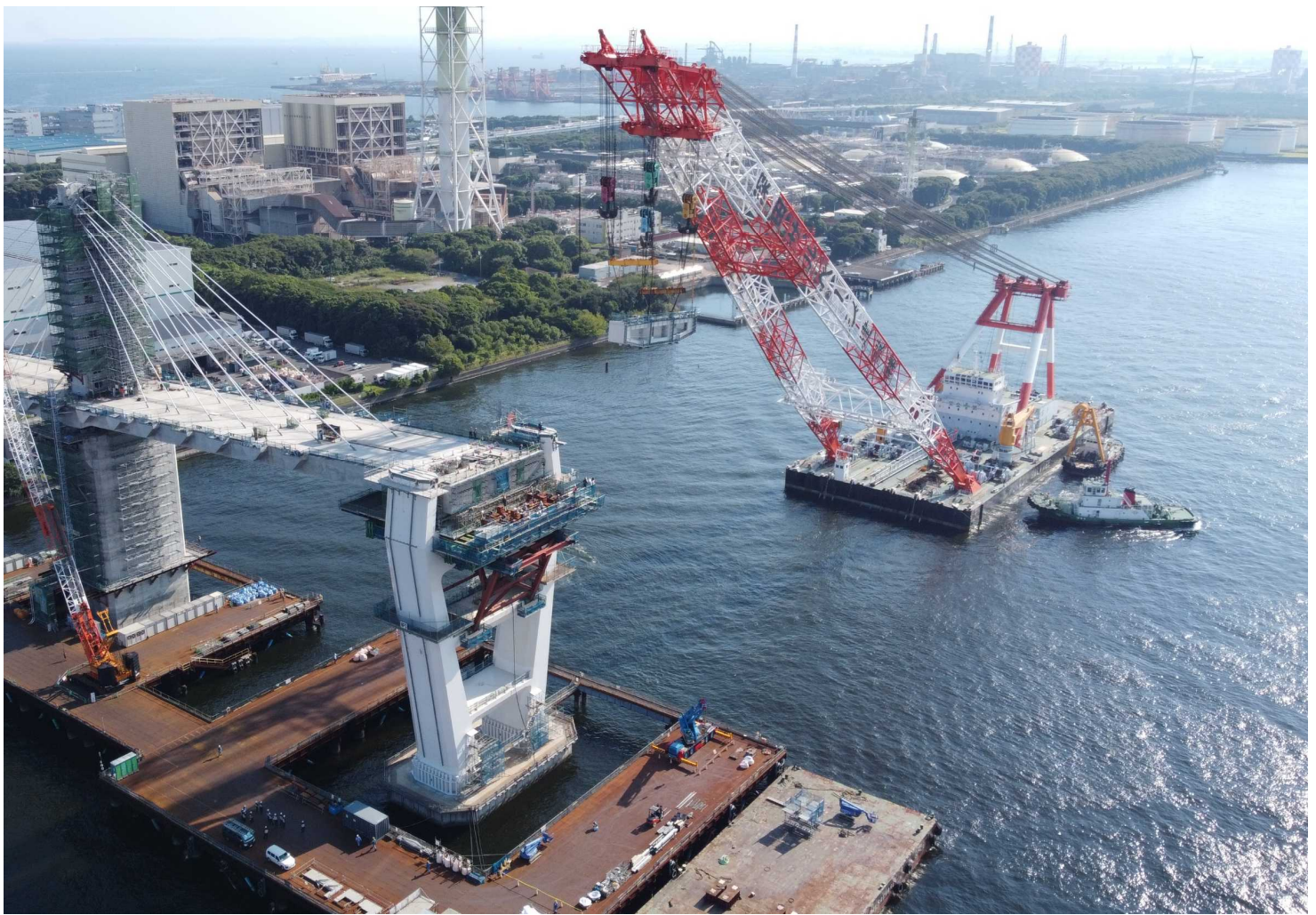
川崎港臨港道路東扇島水江町線 主橋梁部上部 接合桁架設状況