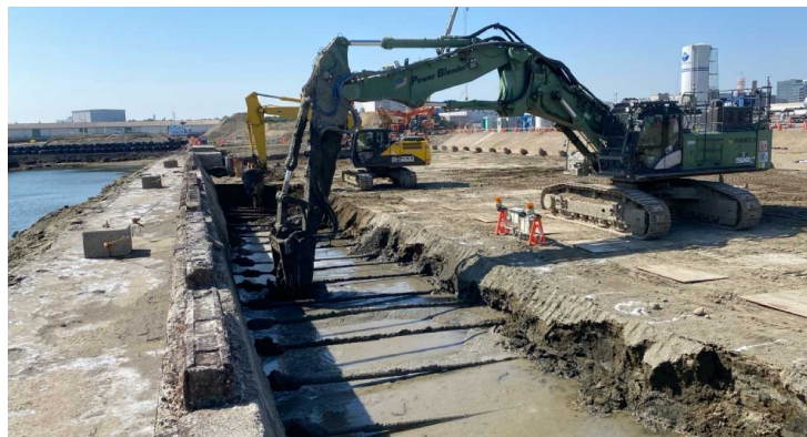
千葉港千葉中央地区岸壁(-9m) 中層混合処理