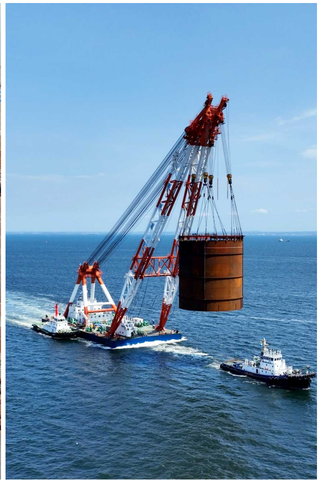
横浜港新本牧地区岸壁(-18m)(耐震) 鋼板セル大組、えい航