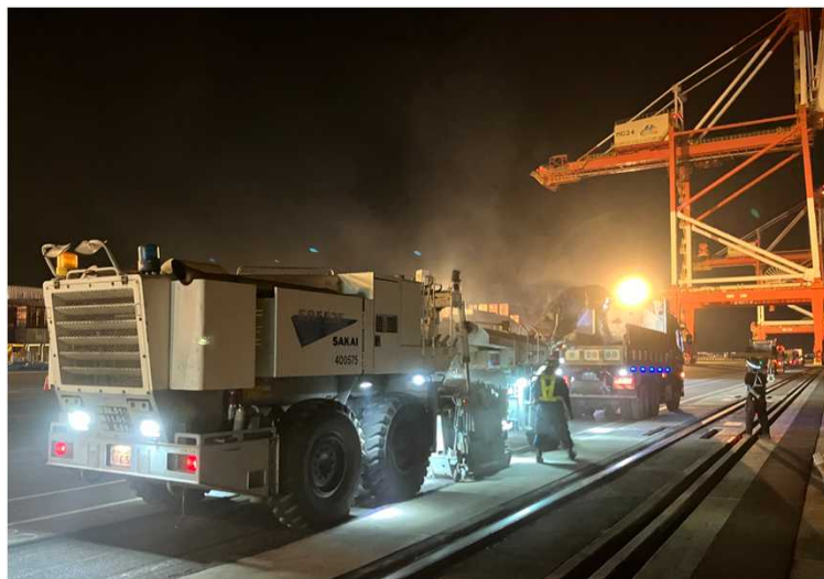
京浜港貸付国有港湾施設 切削工