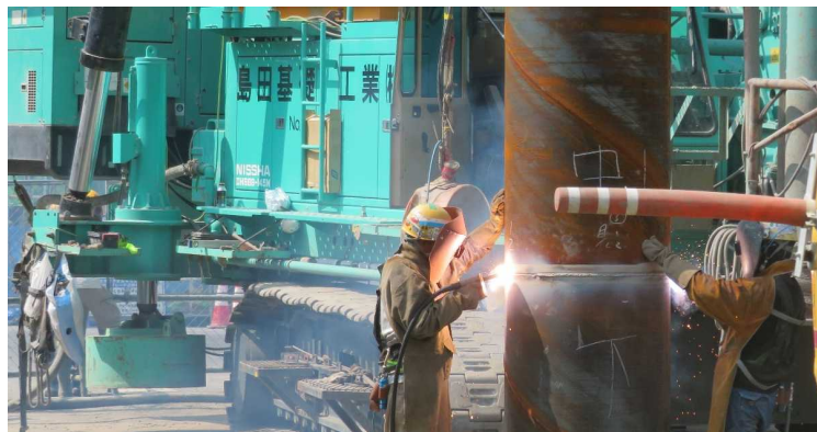
川崎港臨港道路東扇島水江町線水江町アプローチ部 鋼管杭溶接