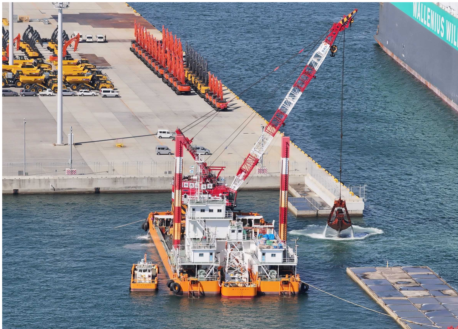
茨城港常陸那珂港区中央ふ頭地区岸壁(-14m) 床掘