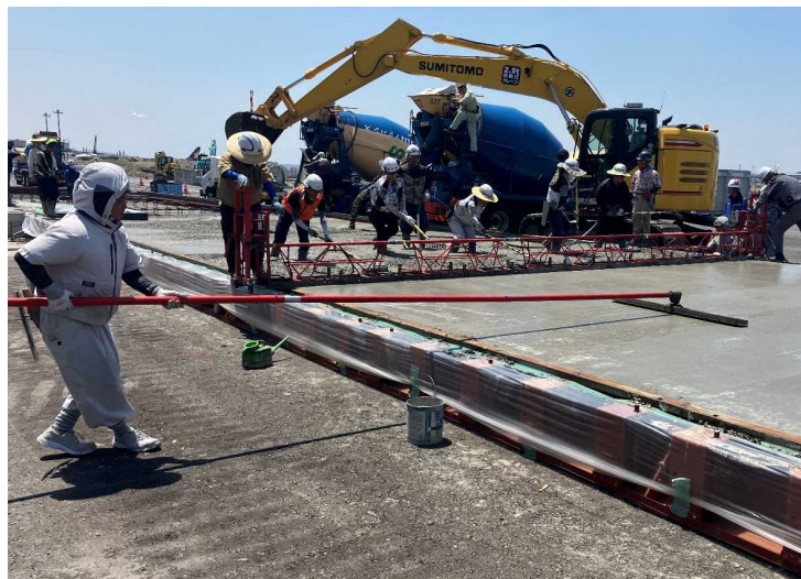
東京国際空港西側貨物地区エプロン コンクリート舗装工