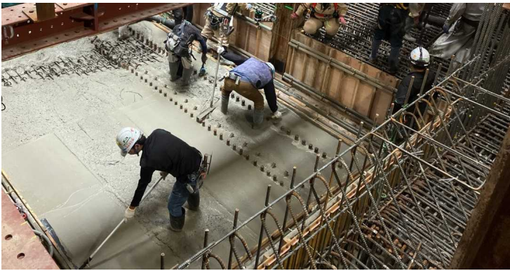
躯体構築（コンクリート打設状況）