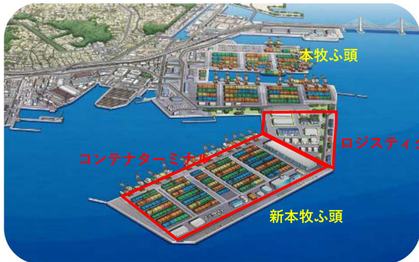
コンテナターミナル ロジスティクス施設 新本牧ふ頭