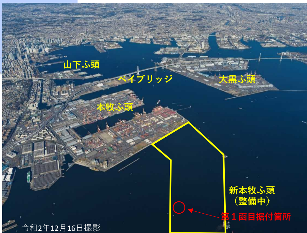
新本牧ふ頭 (整備中) 第1函目据付箇所