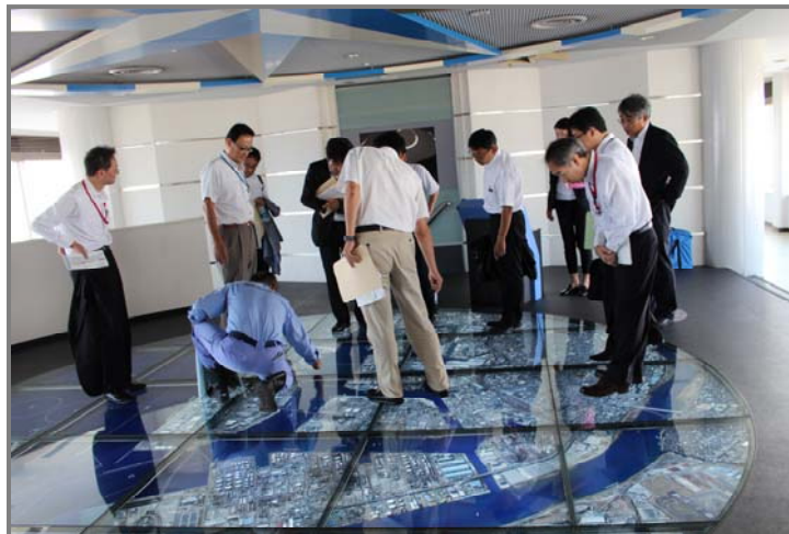
川崎マリエンにて川崎港の視察