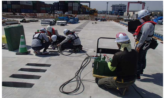
PC鋼より線緊張状況 (令和3年5月)