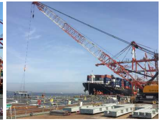
上部工(PC版設置) 令和3年2月