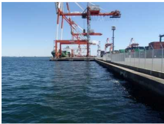
工事着手時 令和2年3月