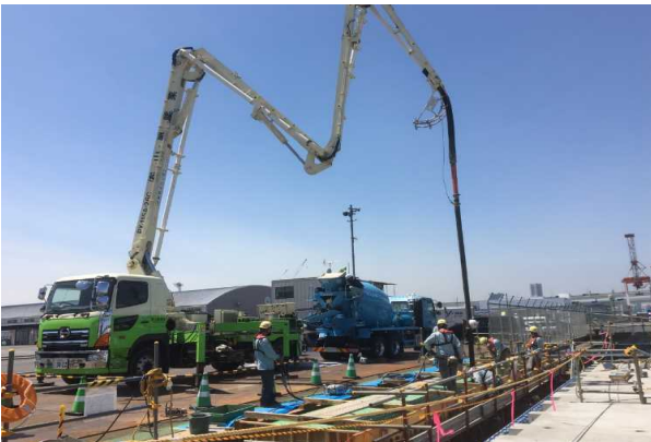
グレーチング渡版基礎コンクリート打設 (令和3年4月)