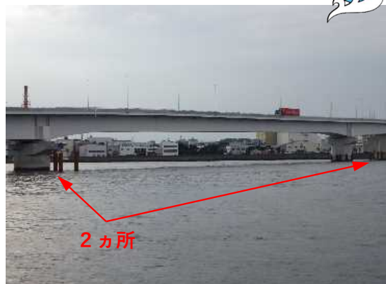
鋼管杭打設完了(2カ所6本)