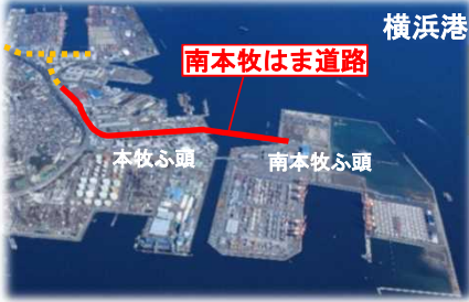
南本牧はま道路（位置図）

令和元年台風15号により損傷した箇所は復旧が終わり、5月7日に供用を再開しました。