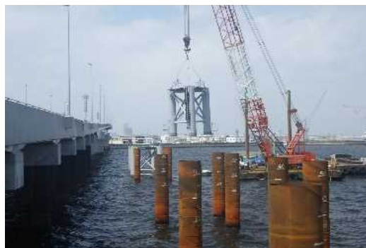
ジャケット据付状況