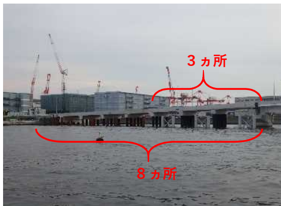
鋼管杭打設完了(8カ所24本) ※3カ所はジャケットが据え付けられた状況