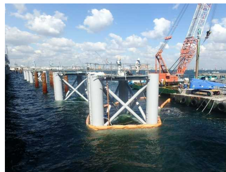
グラウト注入状況