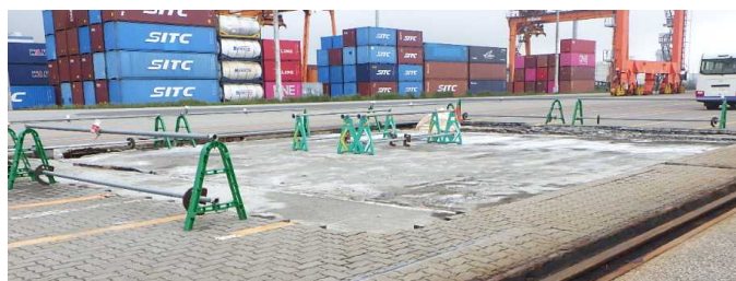
舗装版撤去完了 令和2年7月