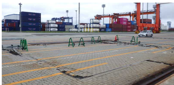
撤去前(着手前) 令和2年6月