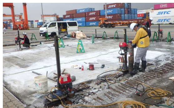
撤去工 PCホロー桁端部コア切断状況 令和2年7月