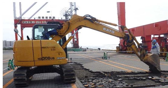
撤去工 舗装版撤去状況 令和2年7月