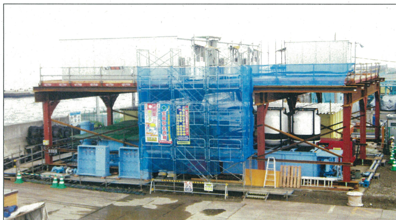
ケーソン設備 共通設備設置完了