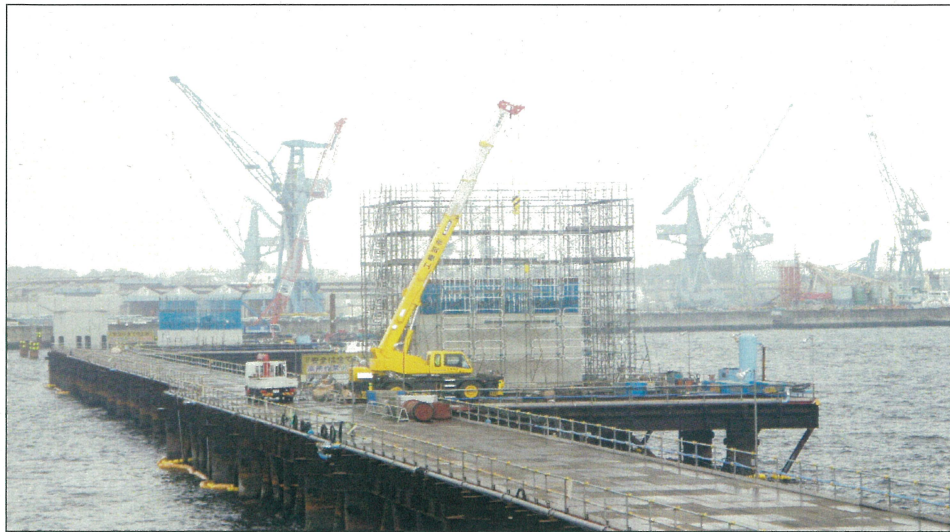
橋脚工 P2・P3橋脚構築は初期構築(7ロット)完了