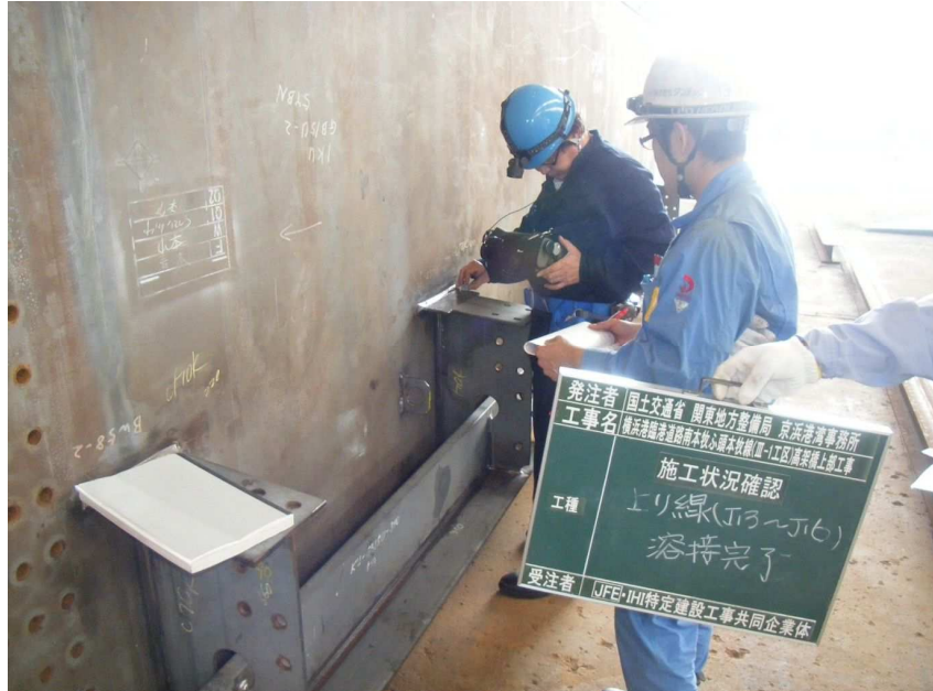
施工状況確認(上り線J13~16)