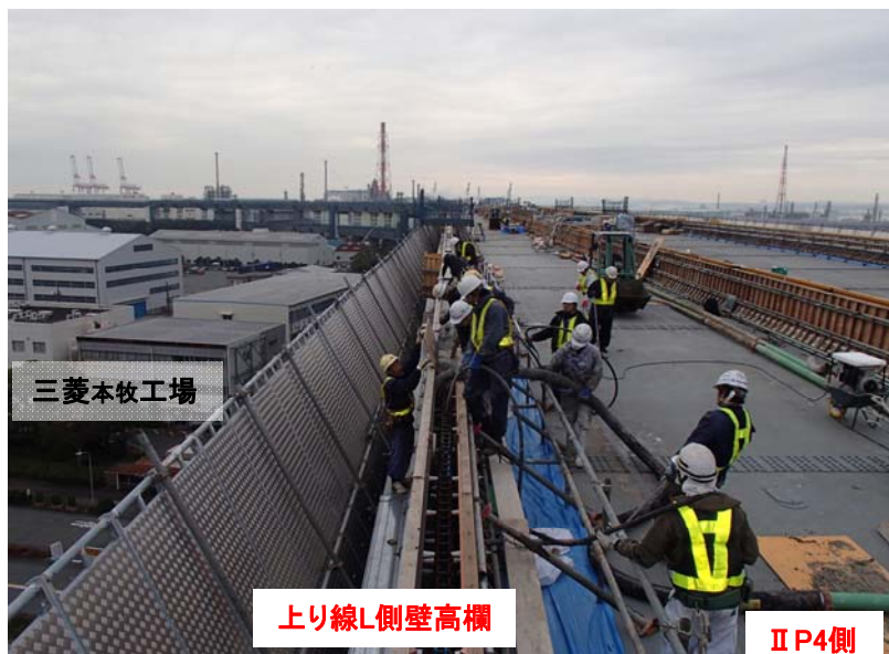
壁高欄施工状況(平成27年12月中旬撮影)