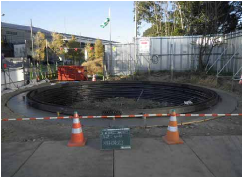
写真 深礎杭施工状況

柱の基礎となる杭部分を掘削するため施工精度の向上を目的として外周にコンクリートを打設しています。