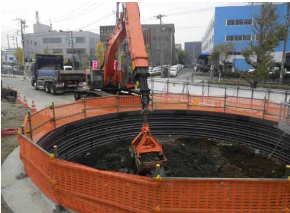
写真 深礎杭施工状況

クラムシェルという機械を使用して杭部分を掘削しています。本工事の掘削深さは13.5mですが、この機械は約20mの深さまで掘削できます。