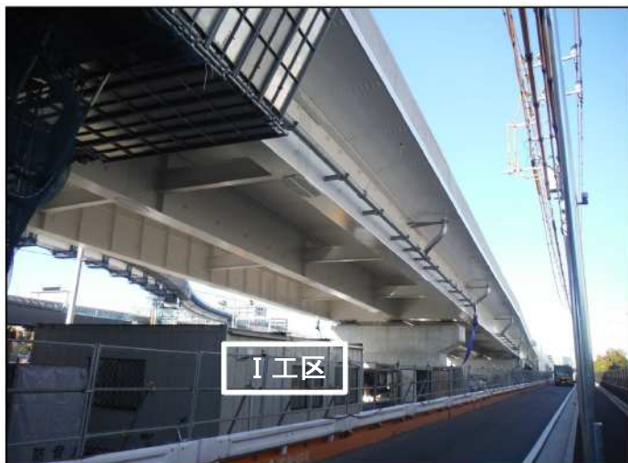
写真② I工区施工完了