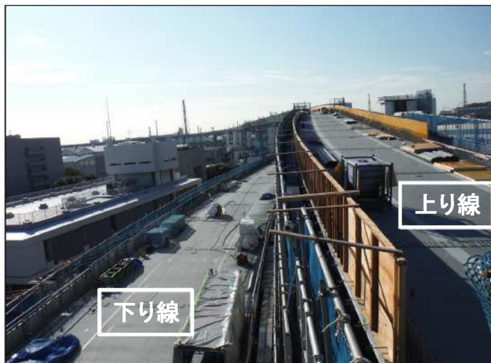
写真③ II工区 施工状況 (写真① 矢視A-Aから望む)