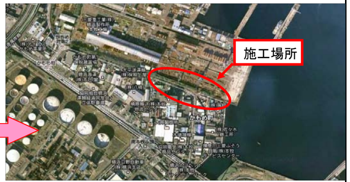
今月の工種別施工箇所平面図