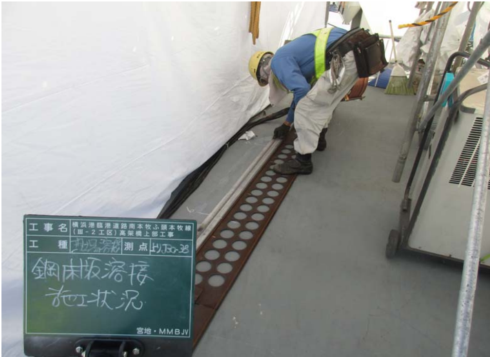
写真① 鋼床版溶接作業状況