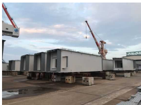
工場製作(4工区・JFE) 令和4年8月