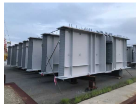
工場製作(5工区・JFE) 令和4年8月