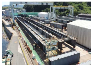
工場製作(5工区・日立) 令和4年8月