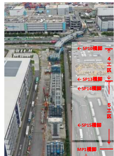
全景(5工区 → 4工区) 令和4年10月