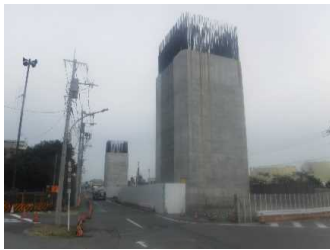
上部工事 MP5橋脚状況