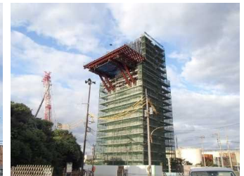
上部工事 MP5脚頭部工 令和3年10月