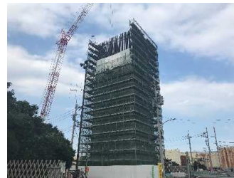
上部工事 MP5脚頭部工 令和3年9月