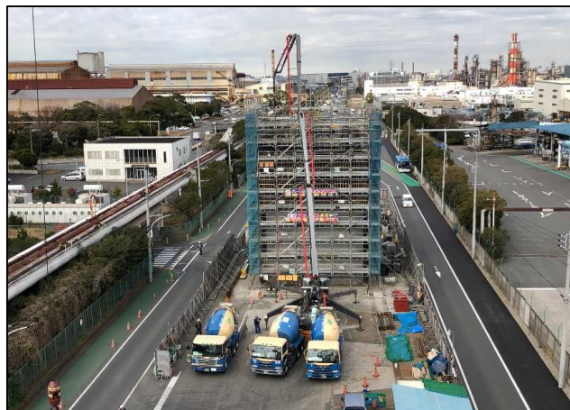
MP6橋脚 コンクリート打設状況