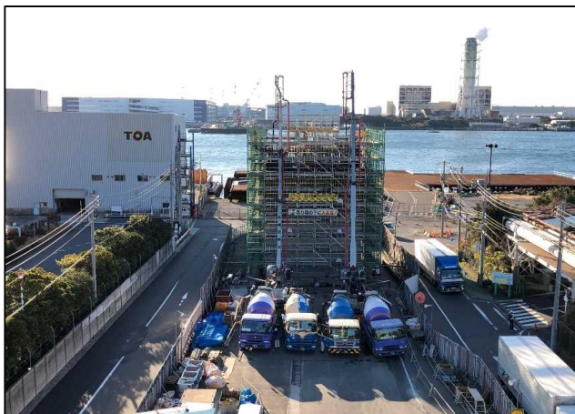
MP5橋脚 コンクリート打設状況

現在、橋脚はMP5で 19.5m 、MP6で 15.5m の高さまで出来ていて、今回の工事では、それぞれまだ 4.5m ほど高くなるよ。橋脚をつくるための仮設足場はもっと高く組む必要があって、MP5で 約28m 、ビル 9階 相当の高さになるんだ。