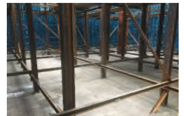
躯体1ロット目打設完了 令和元年12月