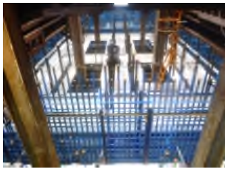
橋脚鉄筋(頂版部)組立 令和元年9月