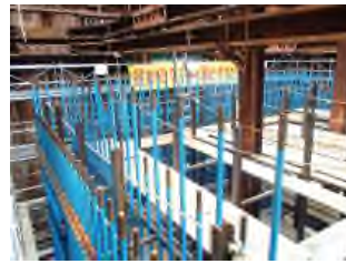
橋脚鉄筋組立 令和元年11月