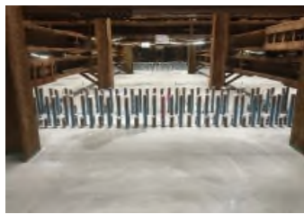
頂版コン5ロット打設完了 令和元年10月