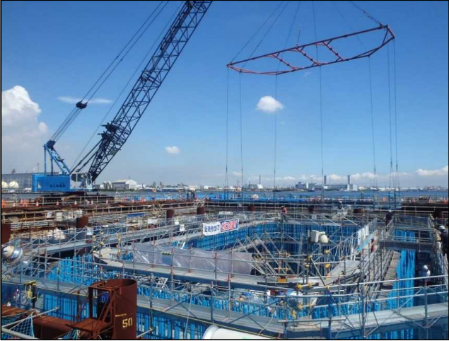
<R1.9> 橋脚鉄筋を組み立てています