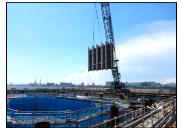
コンクリート型枠組立 令和元年 8月