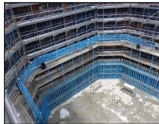
橋脚鉄筋組立 令和元年 5月