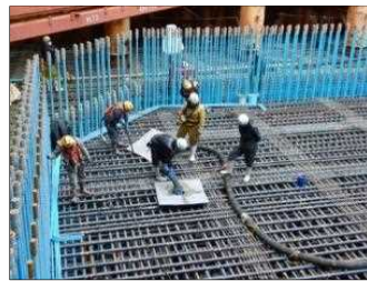
頂版コンクリート 打設 平成31年 2月