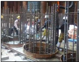
中詰コンクリート 打設 平成30年10月