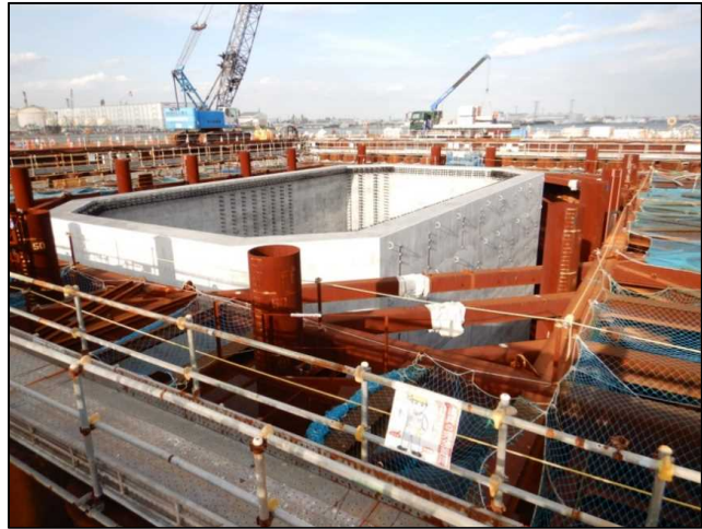
<R1.10> MP3橋脚が完成しました