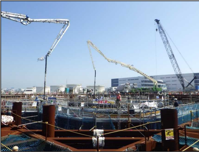
<R1.10> 橋脚構築のため、コンクリートを打設しています