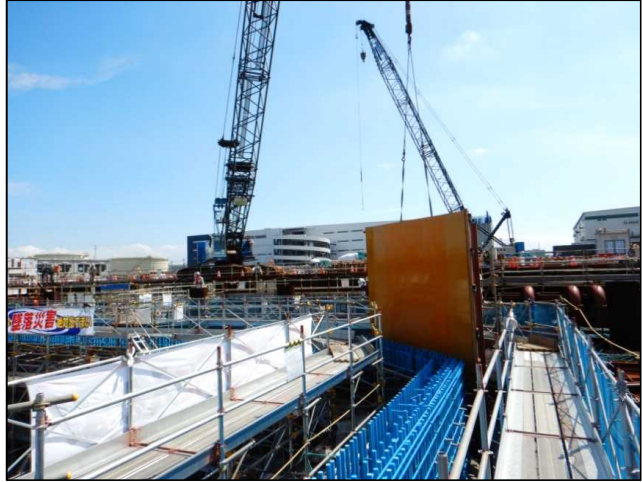
<R1.9> コンクリート打設のため、型枠を組み立てています