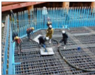
頂版コンクリート 打設 平成31年 2月