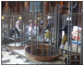
中詰コンクリート 打設 平成30年10月