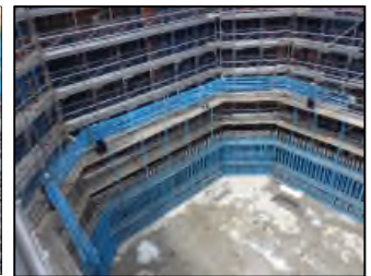
橋脚鉄筋組立 令和元年 5月