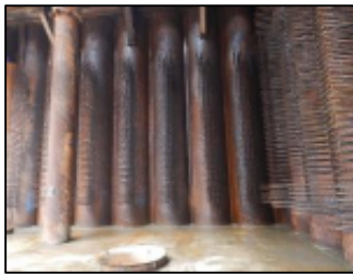
スタッド鉄筋 鋼管矢板に溶接 平成30年 8月