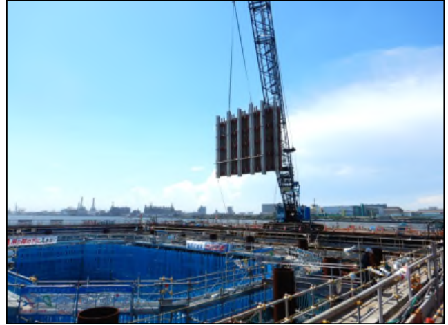
<R1.8> コンクリート打設のため、型枠を組み立てています