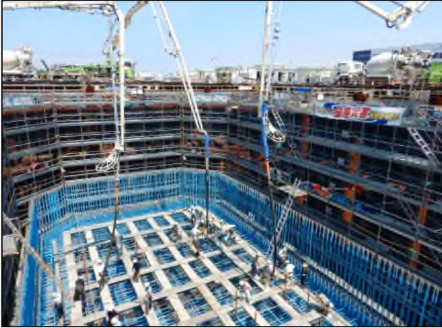
<R1.6> 橋脚構築のため、コンクリートを打設しています