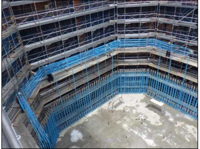
<平成31.4> 橋脚内部の鉄筋を組み立てています