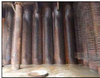
スタッド鉄筋 鋼管矢板に溶接 平成30年8月