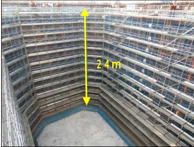
<平成31.3> 橋脚を構築するための足場を設置しました