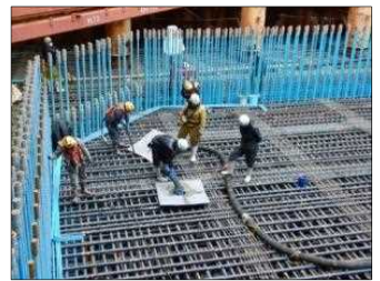
頂版コンクリート打設 平成31年2月