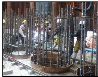
中詰コンクリート打設 平成30年10月