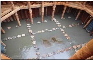
井筒内排水 平成30年5月