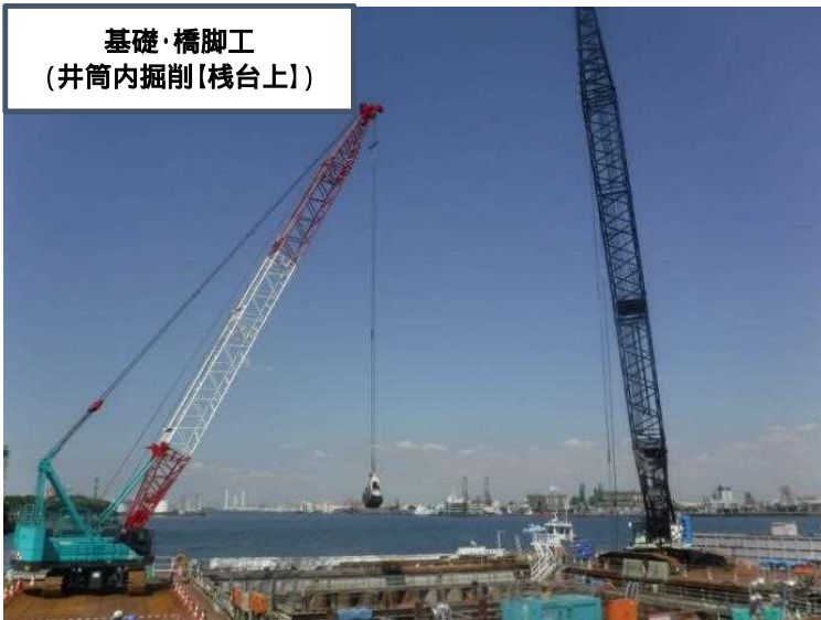
基礎・橋脚工 (井筒内掘削【栈台上】)

現在、鋼管矢板井筒内の土砂をすべて撤去するため、油圧ショベルで掘削しています。 撤去後は、コンクリートを流し込み、橋脚基礎を構築します。