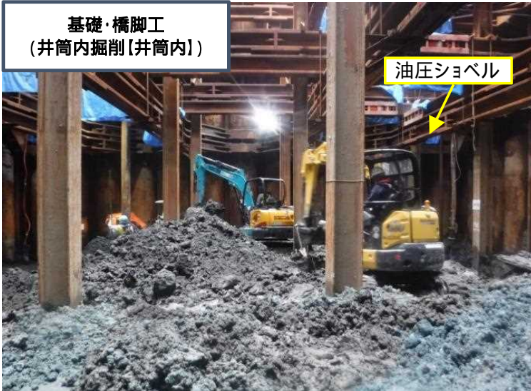
基礎・橋脚工 (井筒内掘削【井筒内】)