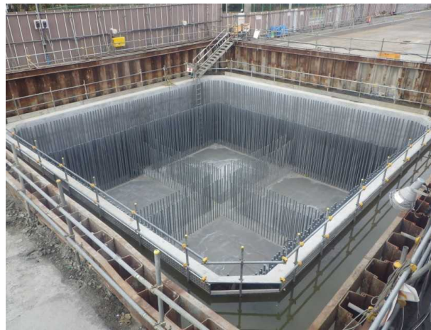
MP5 頂版受け床版コンクリート打設完了