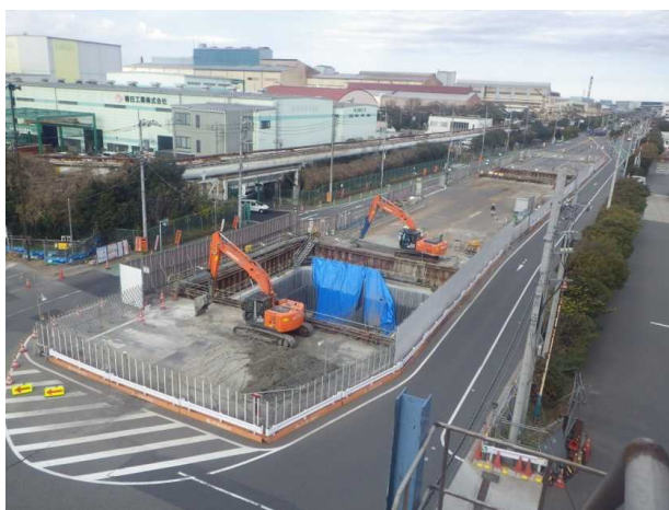
MP5基礎内埋戻し状況