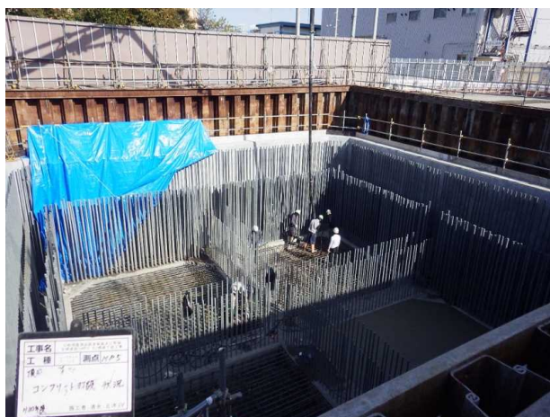
MP5 頂版受け床版コンクリート打設状況