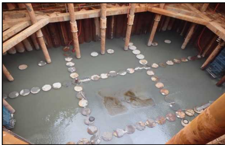
井筒内 排水 平成30年 5月