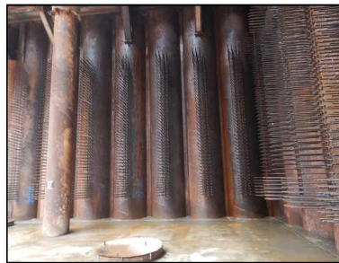
スタッド鉄筋 鋼管矢板に溶接 平成30年 8月