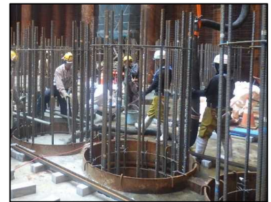
中詰コンクリート 打設 平成30年10月