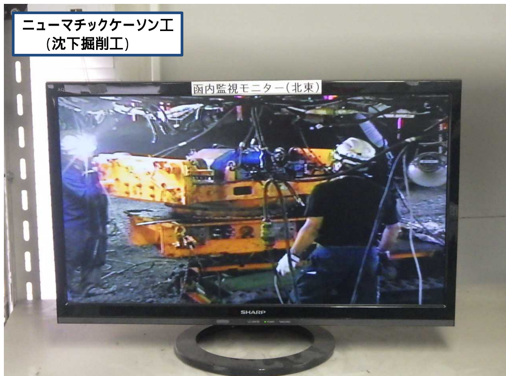
ニューマチックケーソン工 (沈下掘削工)