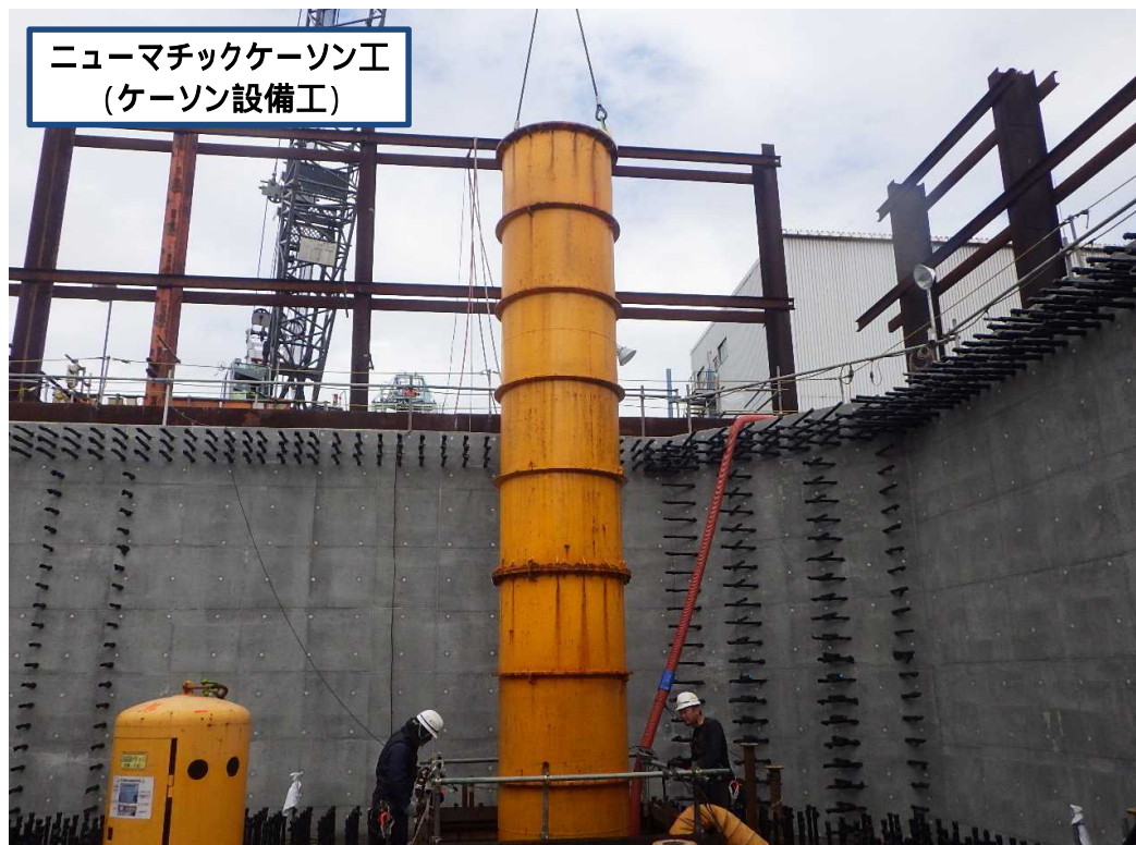
ニューマチックケーソン工 (ケーソン設備工)