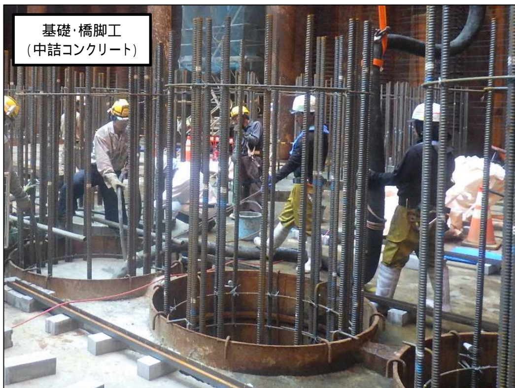
基礎・橋脚工 (中詰コンクリート)