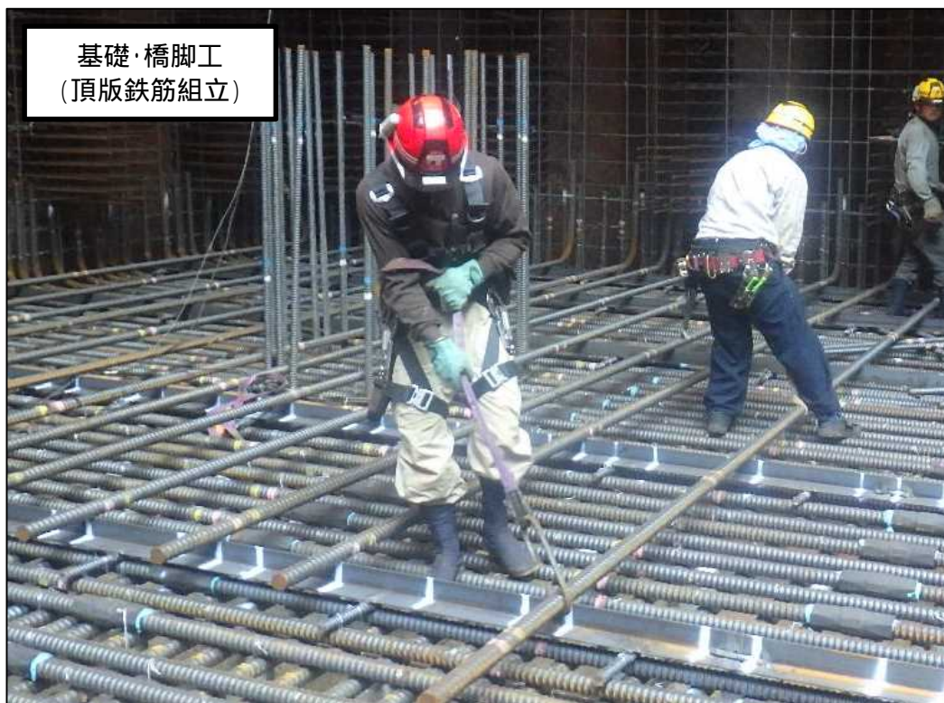
基礎・橋脚工 (頂版鉄筋組立)