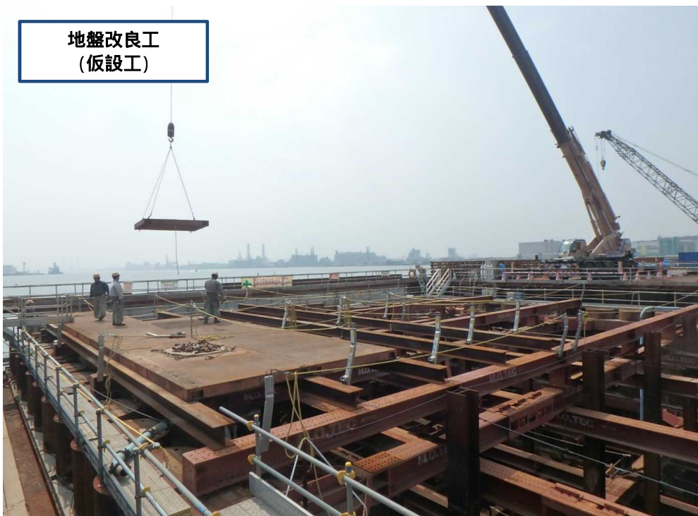
地盤改良工 (仮設工)