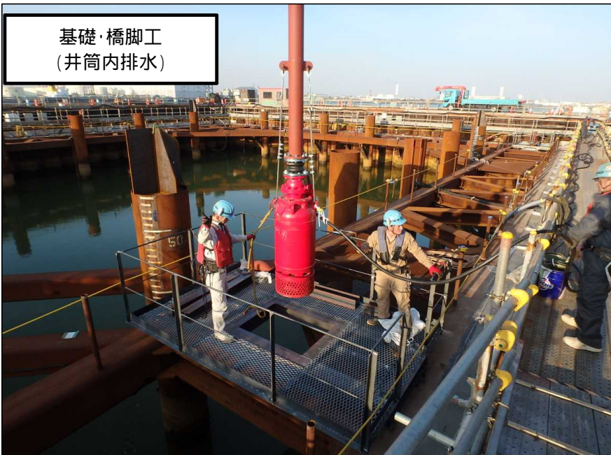
基礎・橋脚工 (井筒内排水)