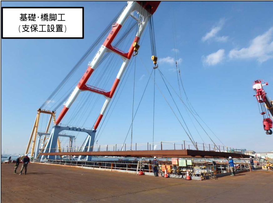
基礎・橋脚工 (支保工設置)