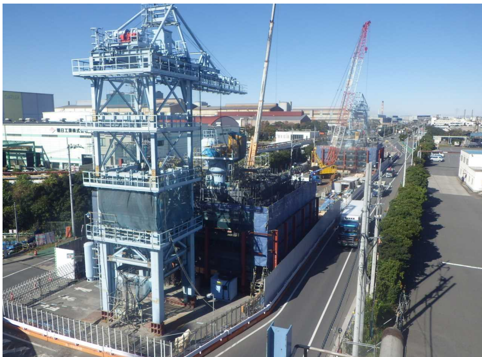
MP5・6 全景 手前がMP5、奥 がMP6です。