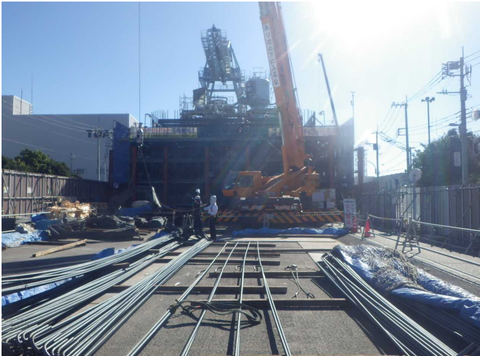
MP5 橋脚基礎 鉄筋組立状況です。