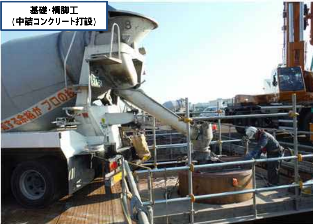
基礎・橋脚工 (中詰コンクリート打設)