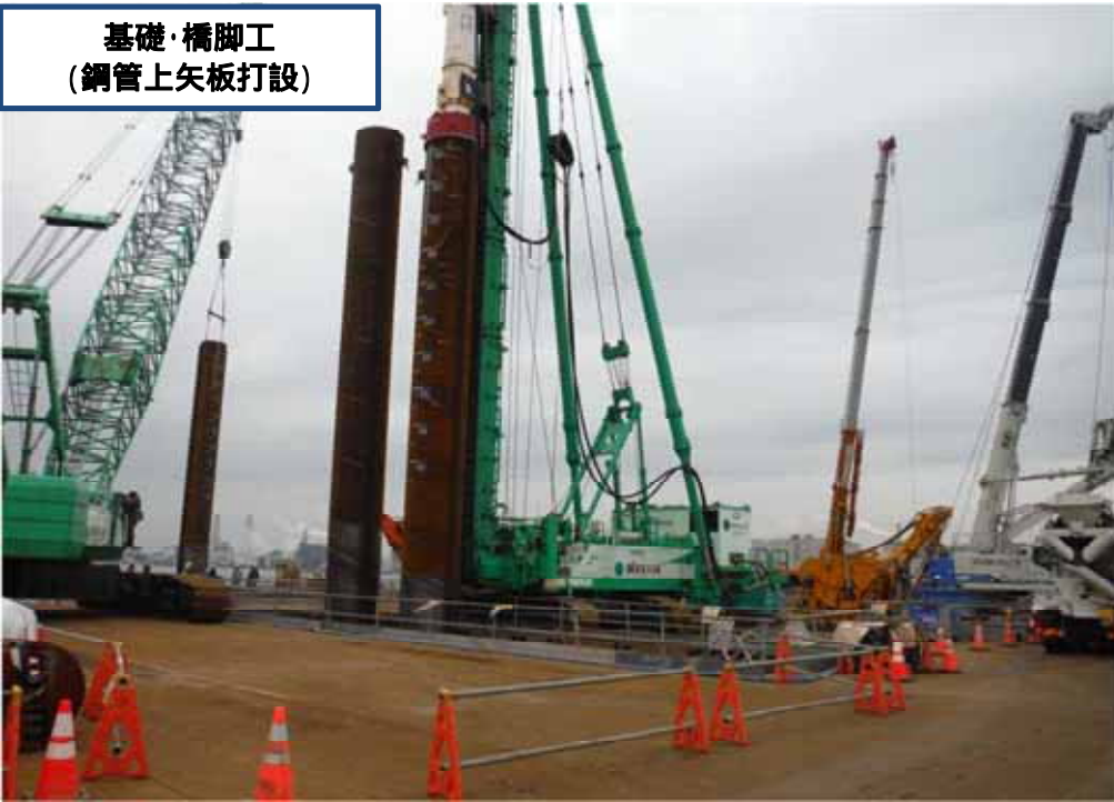
基礎・橋脚工 (鋼管上矢板打設)