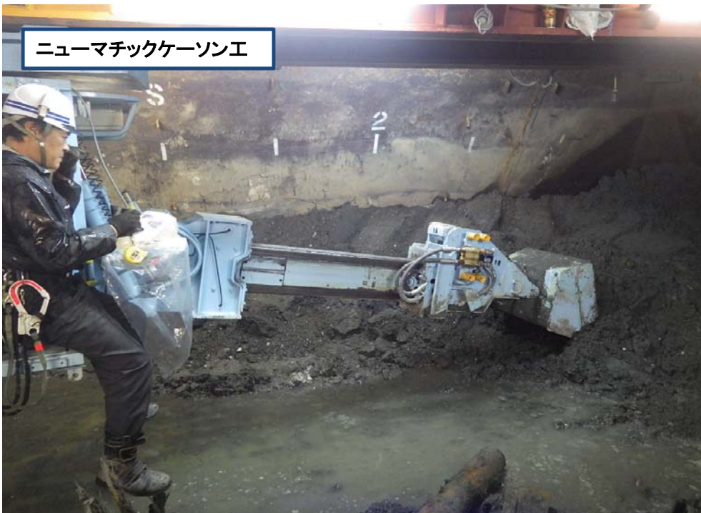
ニューマチックケーソン工