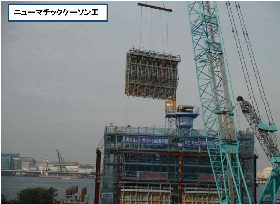
ニューマチックケーソン工