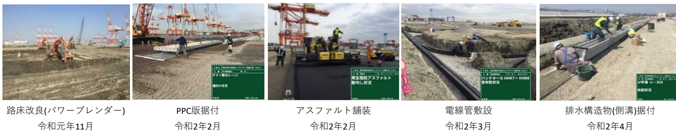
路床改良(パワーブレンダー) 令和元年11月