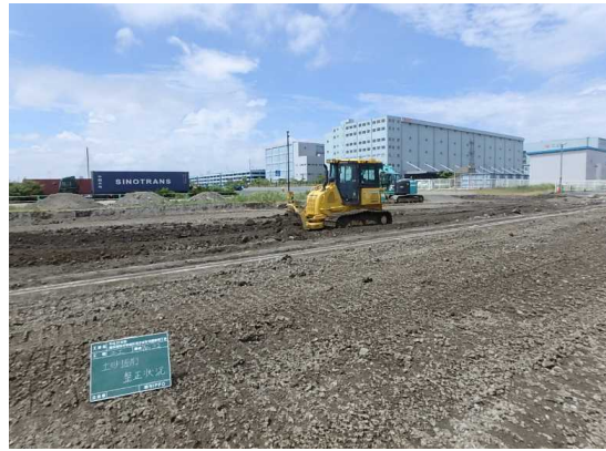
土工 土砂掘削・整地状況 令和2年6月