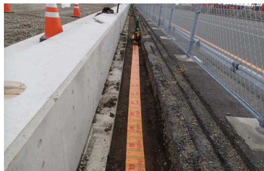
配電線設備工 埋設標識シート敷設 令和2年6月