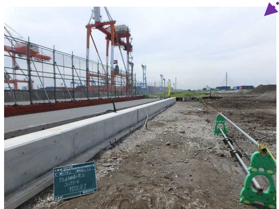
防風・保安用フェンス基礎工 コンクリート打設状況 令和2年6月