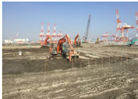
パワーブレンダー施工 令和元年11月