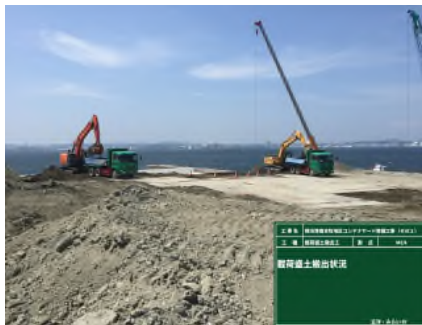
載荷盛土撤去 令和元年 9月