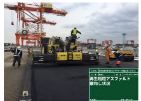
アスファルト舗装 令和2年2月