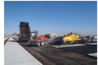
アスファルト舗設状況 令和2年2月