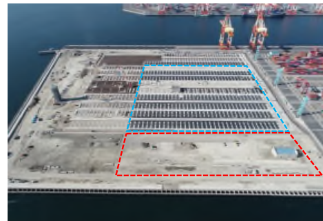
R2.2.10 舗装工 アスファルト舗装