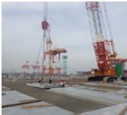
PPC版据付状況 令和元年12月