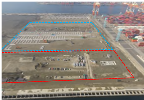
R1.10.30 舗装工 PPC版設置