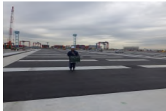
表層完了 令和元年12月