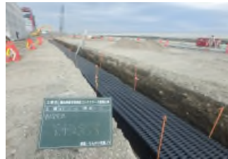
電気管路敷設完了 令和2年1月