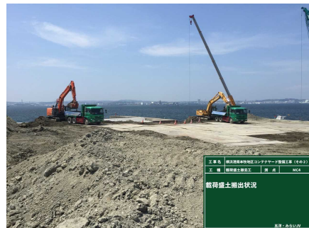
載荷盛土撤去 令和元年 9月