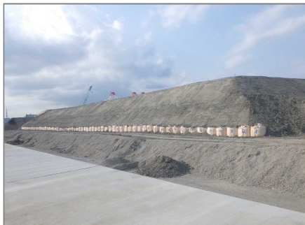
載荷盛土撤去前 平成31年 4月