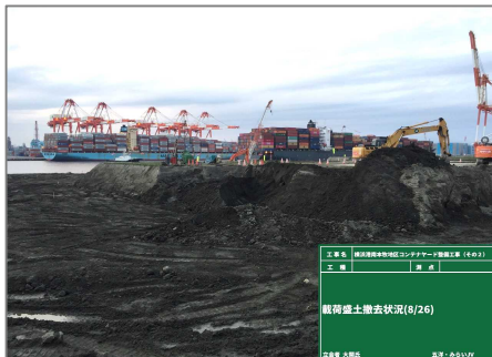
載荷盛土撤去 令和元年 8月